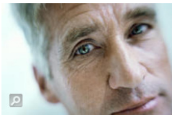
Das Erinnerungsvermögen nimmt im Alter häufig ab

Lernen im Schlaf ist kein Mythos: Damit wir uns an neu Gelerntes erinnern können, muss das Gehirn neue Informationen nachts „verdauen“. Der Ort, an dem das passiert, ist der Hippocampus, ein seepferdchenförmiges Gebilde, das im vorderen Bereich des Gehirns liegt. Während des Schlafs spielt das Gehirn vorangegangene Erlebnisse dort noch einmal ab und legt vermutlich eine Erinnerungsspur an, über die die Informationen wiedergefunden werden können. Wissenschaftler gehen davon aus, dass dieser Prozess entscheidend ist, damit sich Erinnerungen verfestigen können.